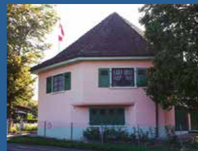
© Association de la ligne fortifiée de la Promenthous

Journées portes ouvertes régulières et visites sur demande