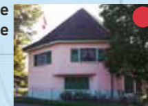
Musée Fortification Villa Rose

Plus d'informations sur la carte interactive, www.sentierhistoriquelacote.ch